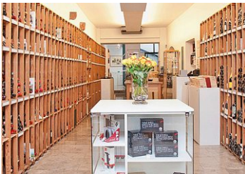
Liechti Weine, liechti-weine.ch und Vive le Vin, Basel, vivelevin.ch