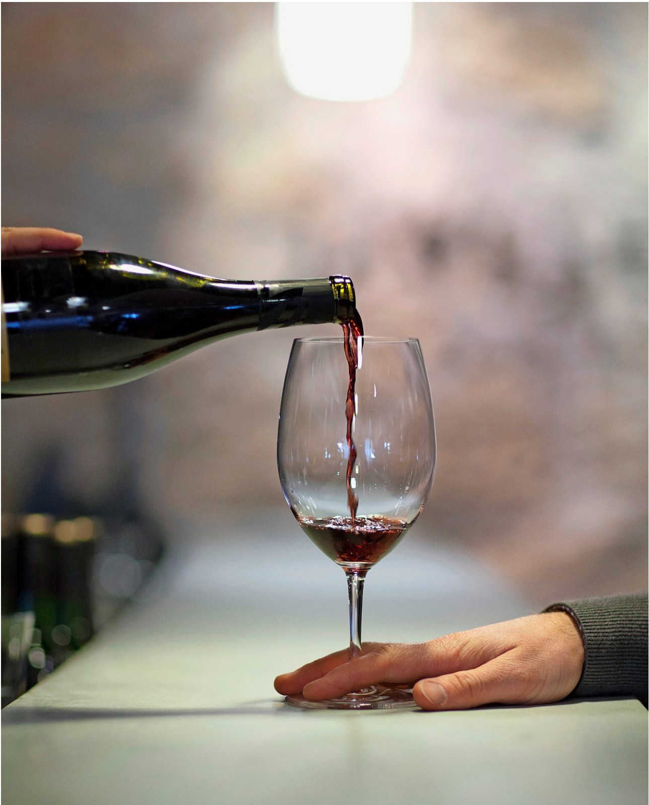
Wasser ist gut, Wein ist besser: Das wunderbare Naturprodukt kann man durchaus zivilisiert geniessen.