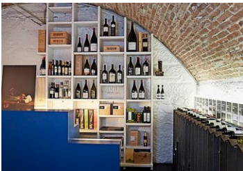
Cultivino, Liebfeld, cultivino.ch und Tredicipercento, Bern, tredicipercento.ch

oder meines piemontesischen Lieblingswinzers Lorenzo Accomasso aus La Morra. Kurz, Weine von eigenwilligen Persönlichkeiten. Zum Weinen schön!