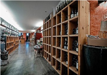
Vin Libre, Neuenburg, vinlibre.ch