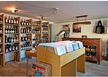
Setpember Vin & Vinyl, Luzern, setpember.ch

So eigen der Name, so speziell die Auswahl an Schallplatten und Weinen. Wer das Ungewöhnliche liebt, wird hier sehr schnell fündig. Mutige Gaumen wagen sich an den Orange Wein der Domaine Bourdy aus dem französischen Jura heran, der begeistert oder erschreckt. Je nachdem.