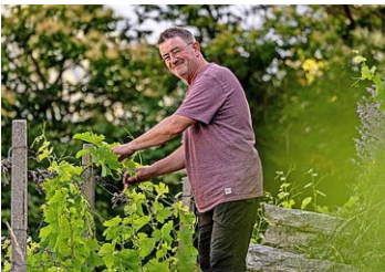
Wein Feer, Münchenstein BL, wein-feer.ch und Paphos Weine, Muttenz BL, paphosweine.ch

gen bis auf 1500 m ü. M. ihre autochthonen Rebsorten kultiviert. Raritäten zu fairen Preisen, bei denen mir der Promara von Tsiakkas Winery sehr gut gefällt.