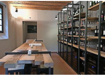
Corte del vino Ticino, Morbio Inferiore TI, cortedelvinoticino.ch